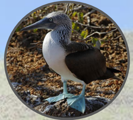
Fou à pattes bleues